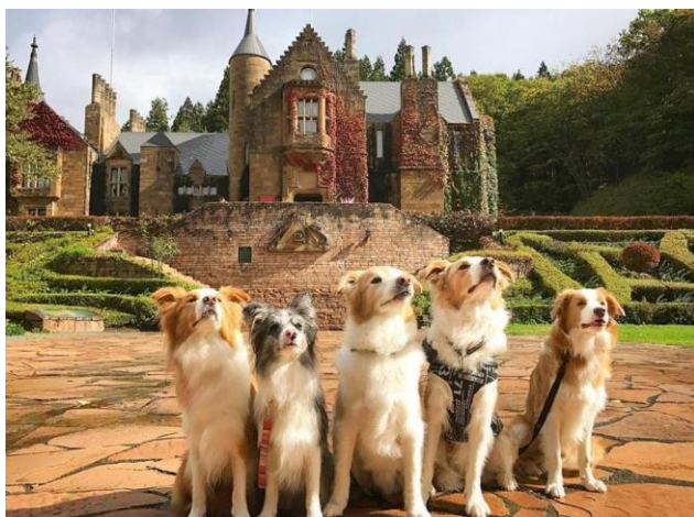
ロックハート城で愛犬のドレス体験