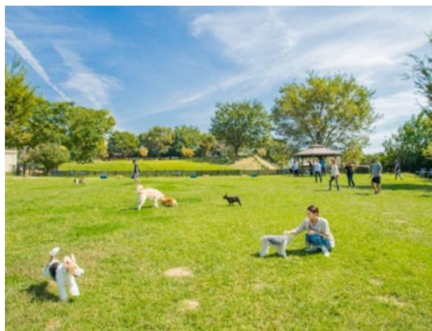
関東最大級の広さを誇るドッグラン施設

<上記リリースに関するお問合せ先> クラブツーリズム広報 TEL:050-3649-8352 E-Mail: ctpr@club-tourism.co.jp